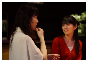
『いないかもしれない 静 ver.』(2015)より